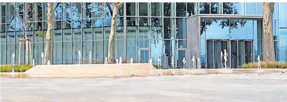
Das Fontänenfeld auf dem Lindenhofplatz