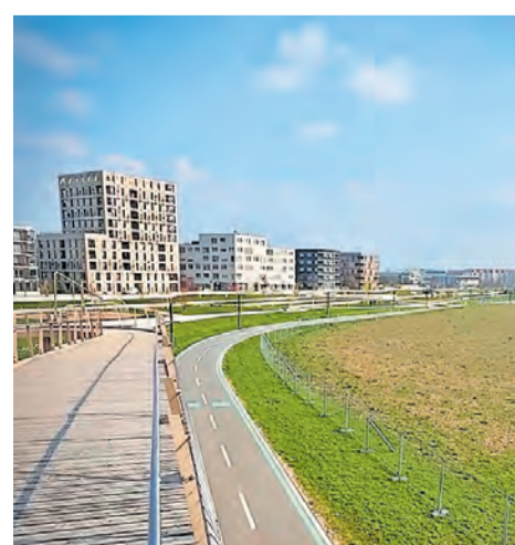
Blick auf die Wohnbebauung auf Spinelli